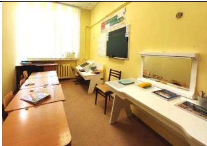
Кабинет учителя - логопеда