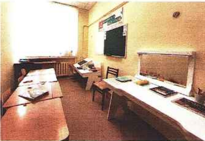
Кабинет учителя - логопеда