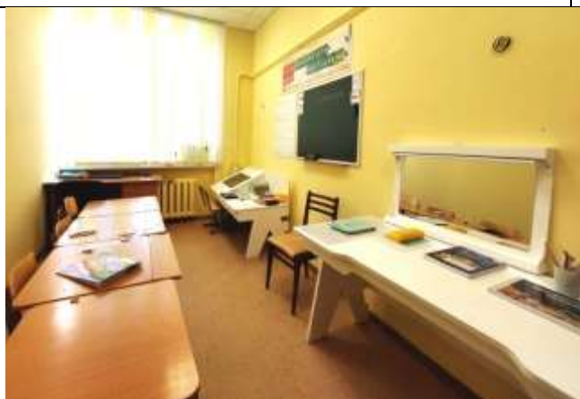
Кабинет учителя –логопеда